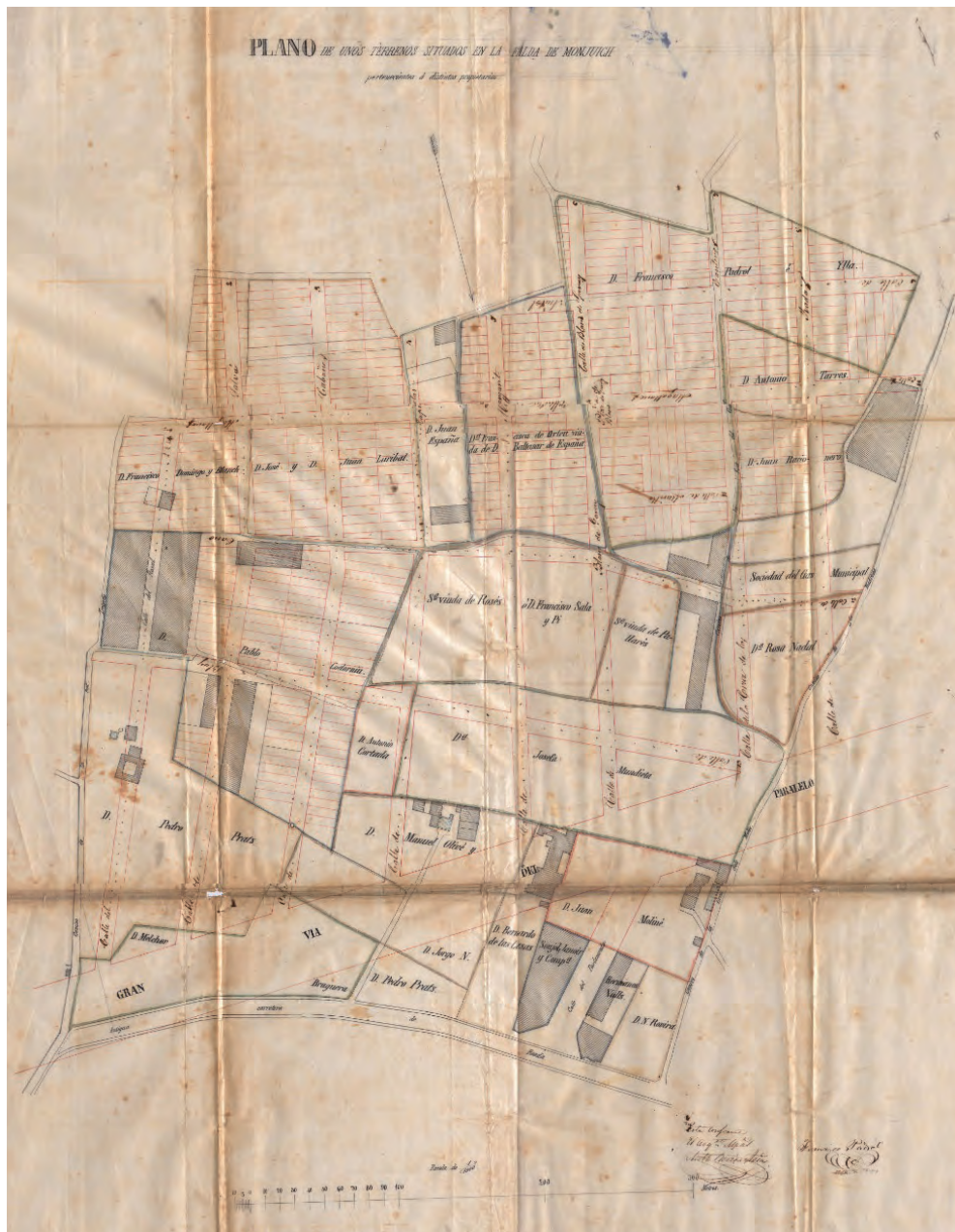
Fig. 4. Plànol ampliat de la urbanització que presenten propietaris de terrenys a l'Ajuntament de Barcelona. «Plano de los terrenos situados en la falda de Montjuich pertenecientes a distintos propietarios». Plànol dels carrers i places de Montjuïc, 1868. AMCB, Q137, AI-135, 1868, 2.