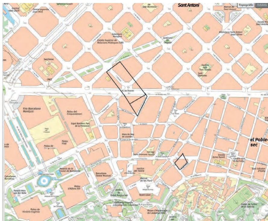
Fig. 1. Situació aproximada de tres de les parcel·les de la família Vallhonrat a l'actual Poble-sec. Elaboració pròpia a partir de la cartografia Vissir 3.35, ICGC.

No hem pogut ubicar les finques de la família a l'Hospitalet, però hem fet una aproximació a les de Cornellà i de Barcelona (Fig. 1) encara que aquí hi manca la que s'ubicaria prop de l'actual plaça d'Espanya. Als terrenys de Montjuïc i de les Barraquetes de Sant Antoni és on concentra més propietat a Barcelona, i, com veurem, serà la zona on la família va esforçar-se més per aconseguir la urbanització.