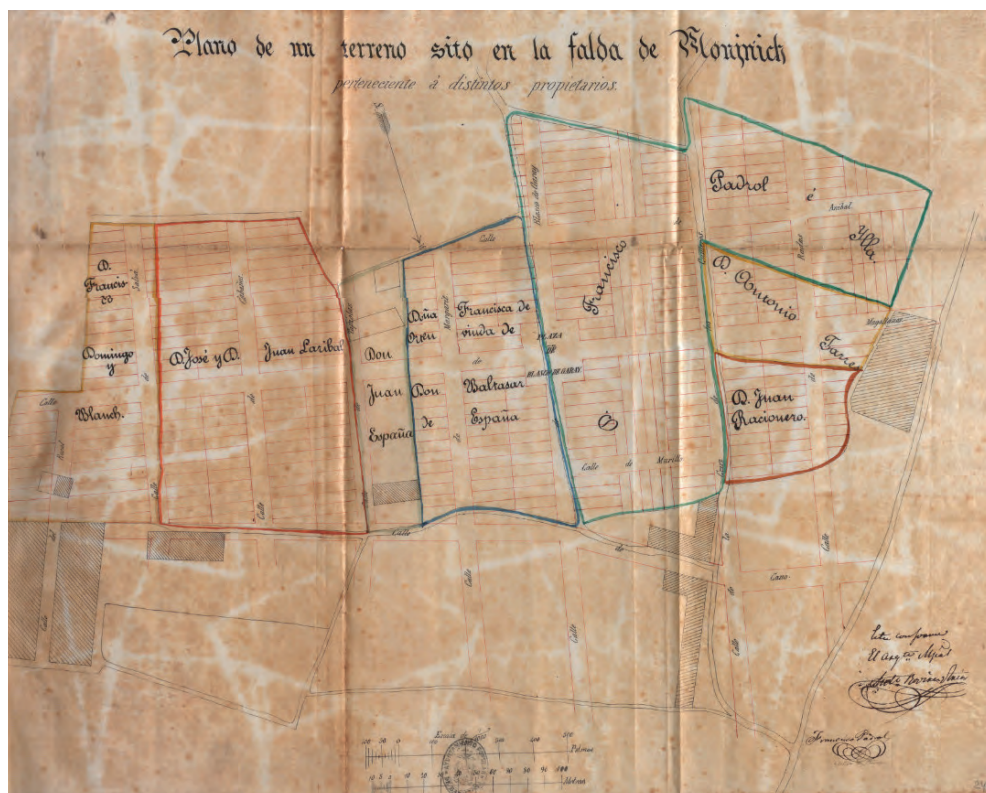
Fig. 3. Plànol de la urbanització que presenten propietaris de terrenys a l'Ajuntament de Barcelona. «Plano de un terreno sito en la falda de Montjuich», Plànol dels carrers i places de Montjuïc, 1868. AMCB, Q137, AI-135, 1868, 1.

posen d'acord per fer un plànol conjunt que harmonitzi carrers, per complir el bàndol de l'alcaldia de 16 de març de 1867, que deia que havia de recaure en l'Ajuntament el traçat de carrers i places. Per això, presenten un plànol d'urbanització de la zona, que signa Francisco Pedrol, i en demanen l'aprovació municipal. 54 A aquesta primera fase deu correspondre un primer plànol que inclou des de l'actual passeig de l'Estació fins al carrer d'Elkano (escrit Cano al document) i, per altra banda, el carrer del Rosal (actual Concòrdia) i de Radas . (Fig. 3)