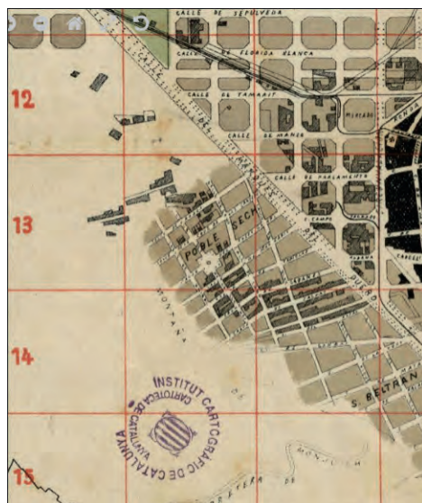
Fig. 5. Inclusió de la urbanització dels propietaris de Montjuïc en la planimetria de la ciutat de Barcelona. Plànol anunciador de Barcelona, 1870. Joan Calvet Boix. ICGC. (Fragment)

Amargós. 59 El resultat és que el barri no està format per carrers amples i igualitaris com l'Eixample de Cerdà, sinó per carrers estrets i tortuosos de l'Eixample dels propietaris del Poble-sec, per crear un Eixample menor industrial i obrer.